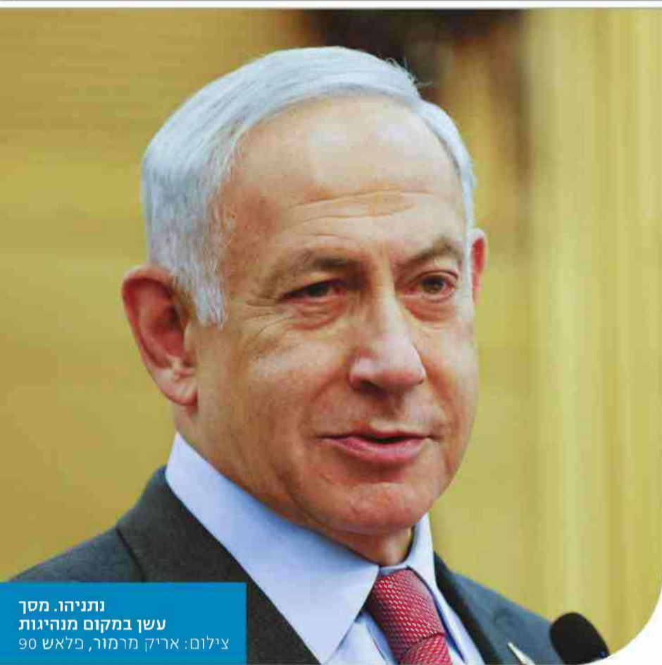
נתניהו. מסך עשן במקום מנהיגות