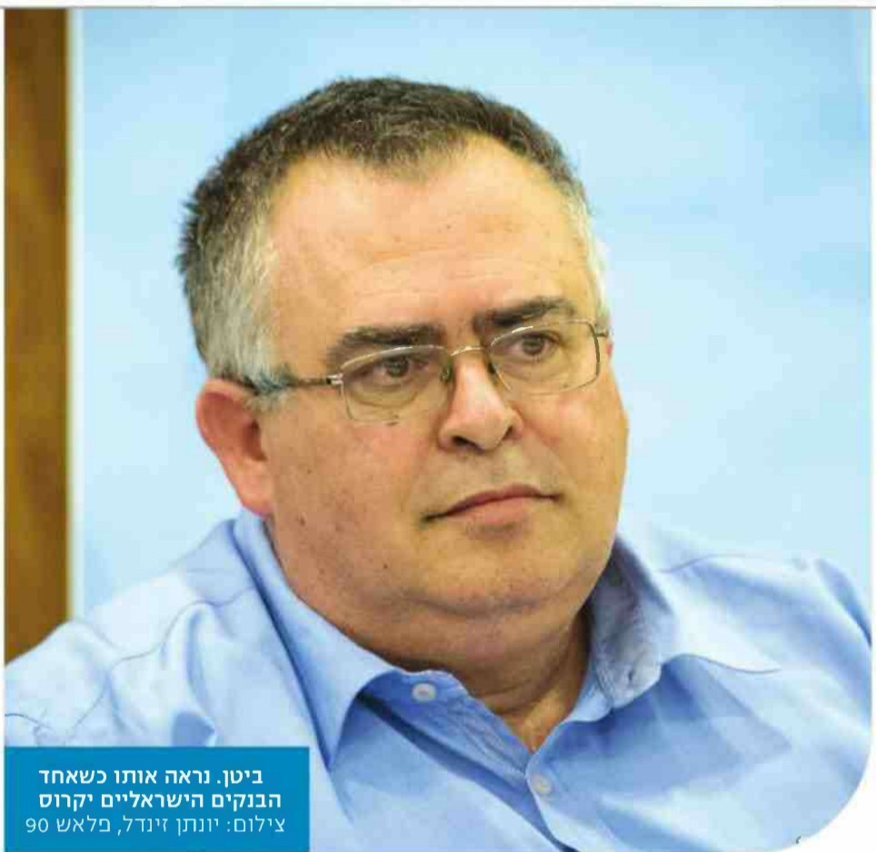
ביטן. נראה אותו כשאחד הבנקים הישראליים יקרוס

אחד הוא אחראי, טועה ומטעה. שני הצדדים שופכים שמן למדורה. גם אני הייתי חלק ממי שהיה מאוד אגרסיבי בשיח הציבורי, אבל בשלב מסוים הפנמתי שזו לא הדרך.