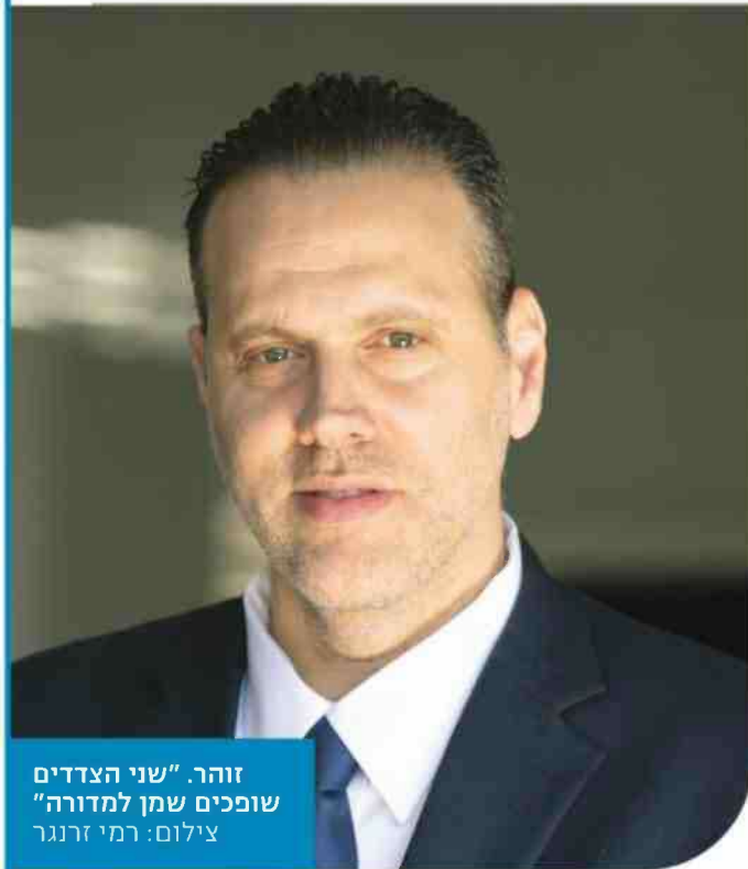
זוהר. "שני הצדדים שופכים שמן למדורה"