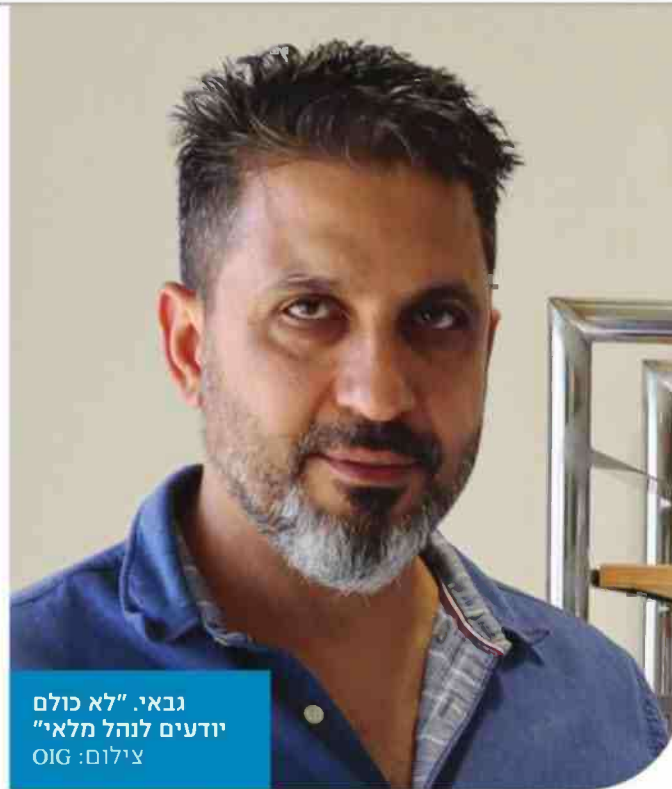
גבאי. "לא כולם יודעים לנהל מלאי"