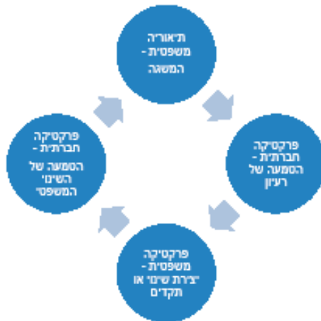
איור 2: המודל המעגלי של עריכת דין לשינוי חברתי

עריכת דין אקטיבית לשינוי חברתי היא חלק מהליך מעגלי נמשך: